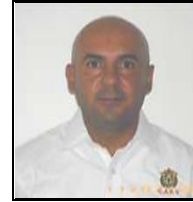
Jefe de la Oficina Operadora

La dirección de la Oficina Operadora es calle Miguel Lerdo de Tejada número 42, colonia Centro, C.P. 92800, Tuxpan, Ver., y cuenta con el sitio web http://187.174.252.244/caev/Oficinas_Operadoras/Tuxpan/ .